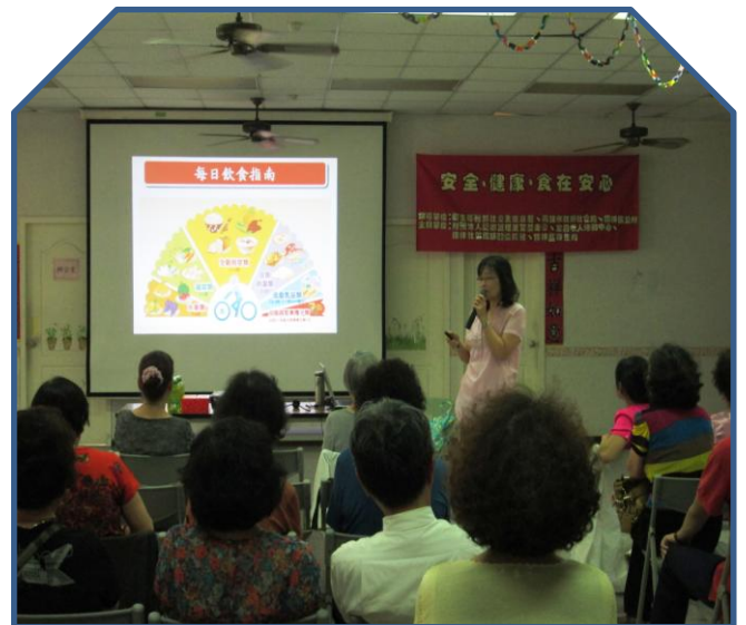
楠梓食在安心健康講座