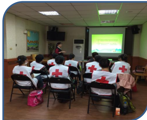
高雄居家護理代訓照服員實習