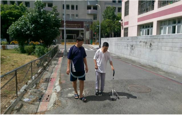
陪伴走一段復健漫漫長路，雖然難熬但我陪你一起渡過