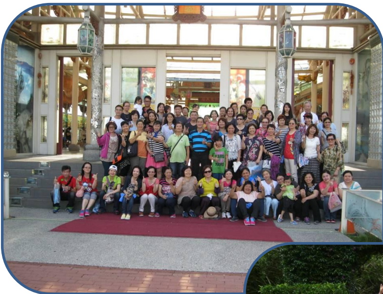
南/北區員工快樂一日遊