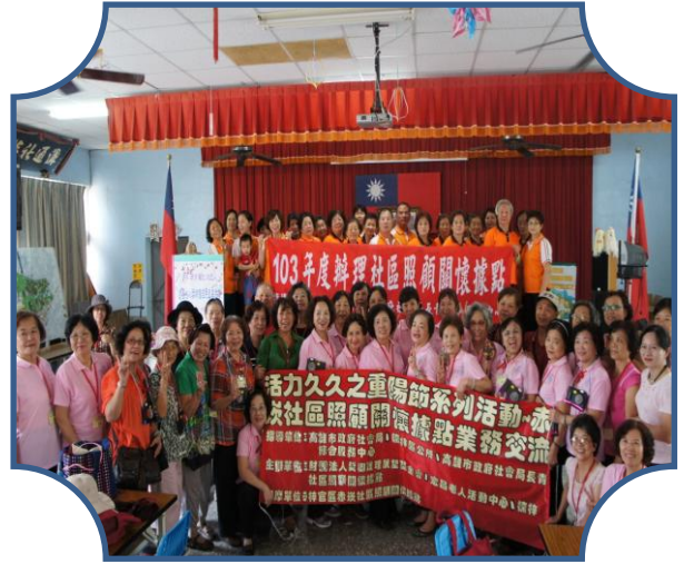
楠梓至梓官區赤崁社區交流