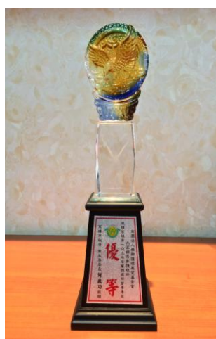
高雄/臺北居家護理 103 年榮獲督導考核優等獎