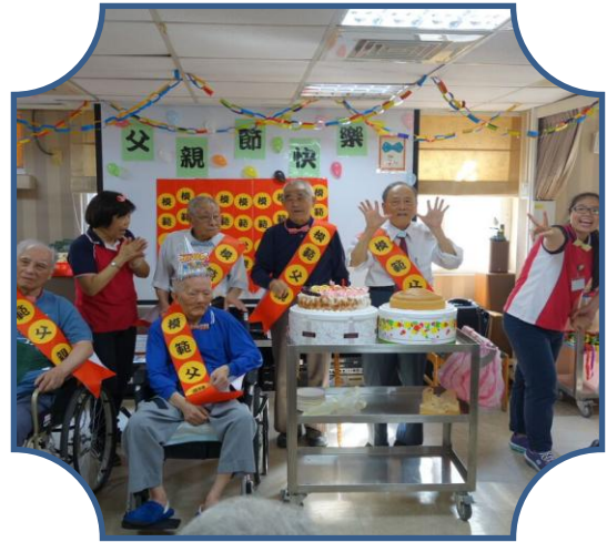
文山養護中心慶祝父親節活動