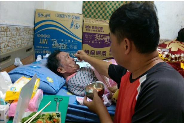
每次服務時我都有不一樣的名字，永遠不是蘇先生，但是結束後總會有一聲”謝謝”