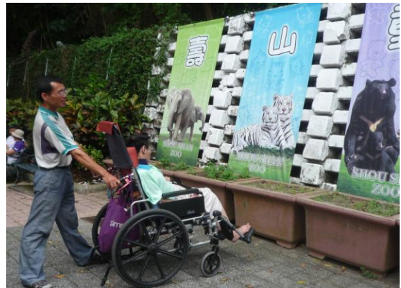
一同出遊壽山動物園