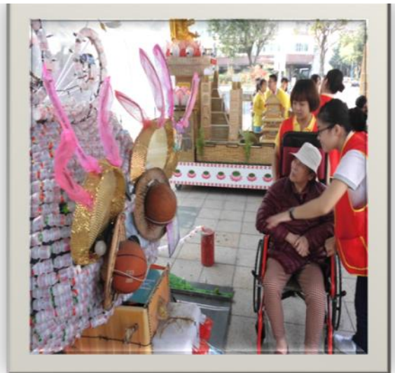
護理之家住民出遊賞燈會