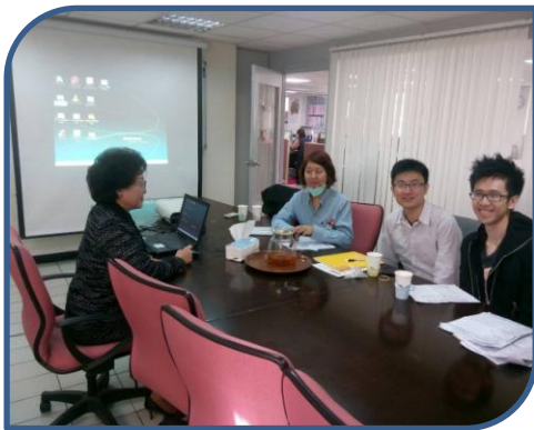
秘書長予 pgy1 醫師訓練