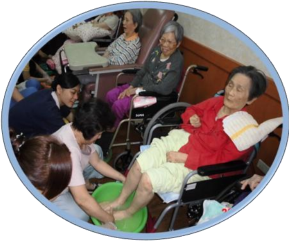
護理之家五月母親節活動