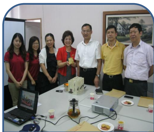
上海市嘉定區人民政府參訪