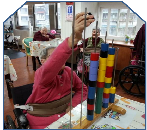
文山養護中心住民復健運動