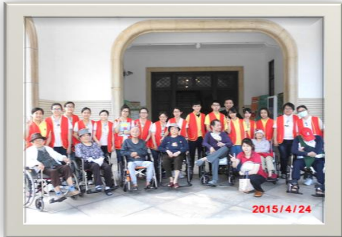
護理之家住民出遊參訪歷史博物館