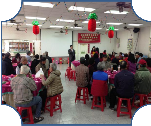
董事長參與楠梓喜氣洋洋獨居長輩圍爐活動