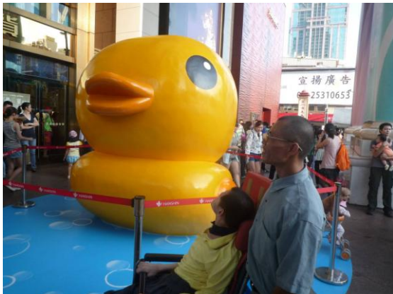
與個案一起觀賞黃色小鴨

很快的方法奏效了，從此服務時都可以陪伴案主一起五四三，常藉口與電腦相關事件需外出，就這樣把案主從大樓中引到樓下，雖然只是在案主家附近晃了一下，辦了需要的事，就看到案主開心得不得了。於是便慫恿案主辦個捷運卡或網路訂個復康巴士，就可以去更遠地方玩，從此也激發出案主生活上的願望，當每次陪伴外出時，案主都非常的快樂，例如：街頭看美女、去看資訊、藝文、建築、汽車、婦幼等展覽，還去看電影，欣賞當紅的黃色小鴨，逛旅遊景點動物園等等，都帶給案主無限的樂趣。將來還要坐船去旗津及去茄萣欣賞刀劍博物館，我心裡想這或許是已經開創出在社會局或機構中在休閒活動上第一個一起與案主玩樂的個案，我實現了對案主創造與圓滿需求及樂趣，我也實現鼓勵男性加入從事這個居家服務的行列。