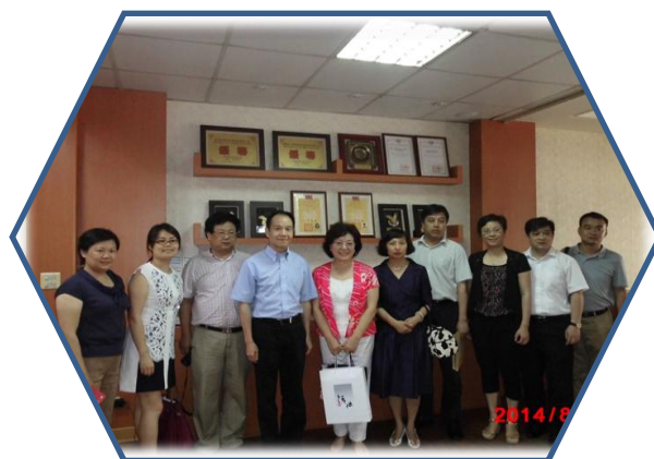
上海市徐匯區民政局參訪