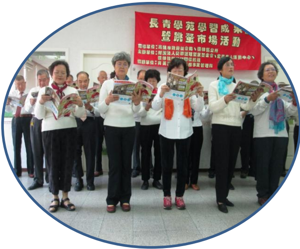
楠梓長青學苑大家說英語