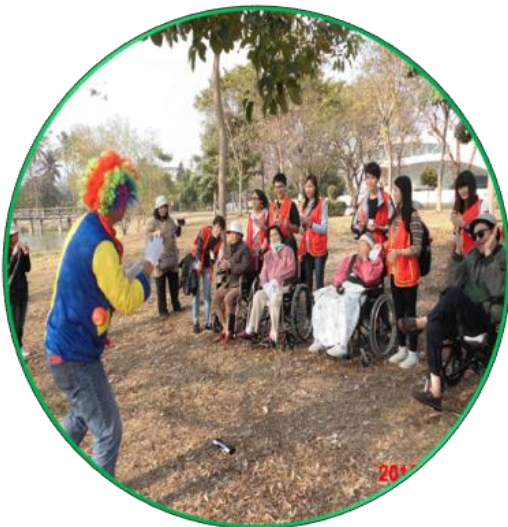
護理之家住民出遊衛武營都會公園