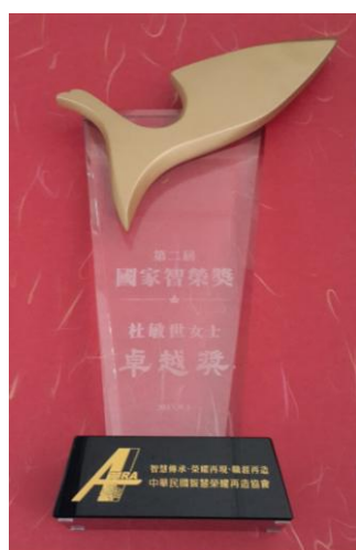
杜敏世秘書長榮獲 104 年全國智榮獎之卓越獎