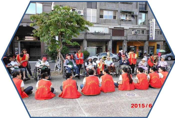
護理之家住民午後公園趣