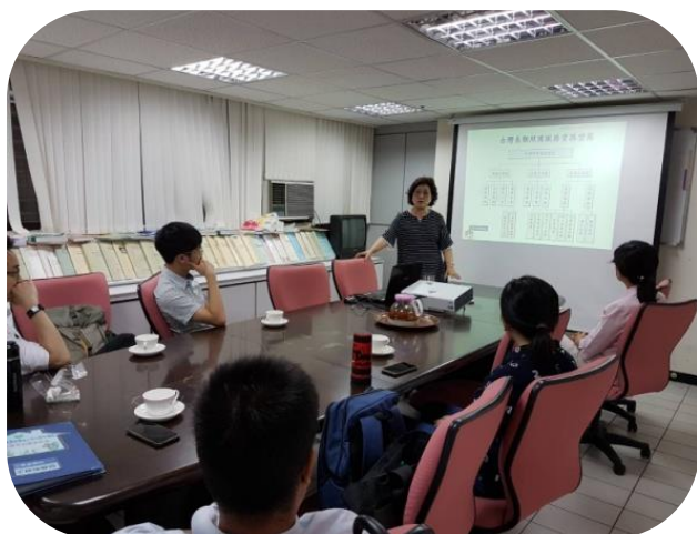
中心診所醫師 PGY1 實習