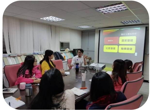
臺北居護暨居服復健課