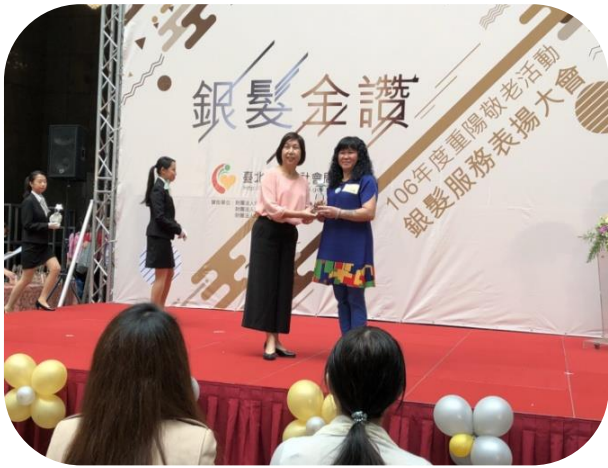
莎麗照服員獲頒 106 年臺北市社會局 銀髮金讚外籍照服員服務優良獎