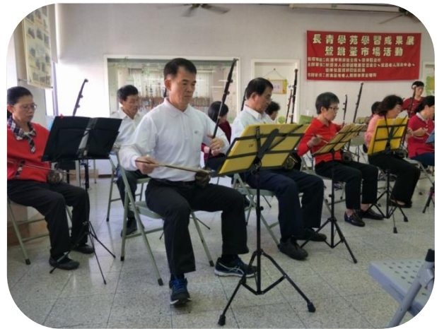
楠梓二胡中級班成果發表