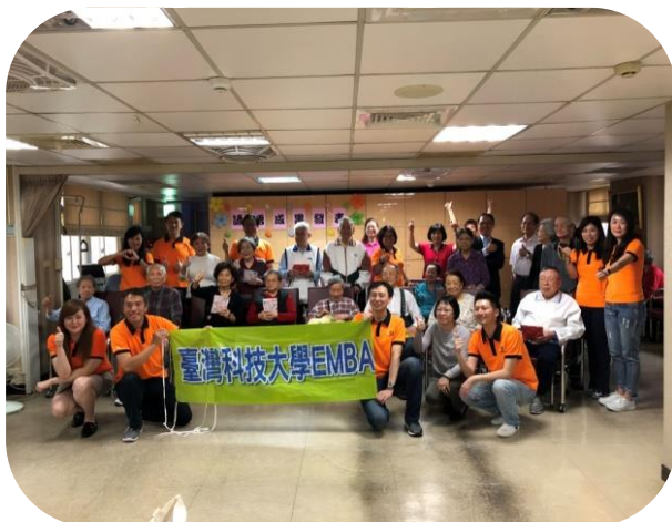
國立台灣科技大學 EMBA