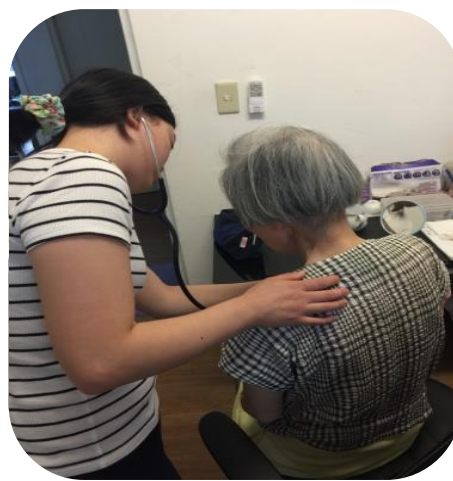
PGY 1 醫師跟隨居護居家訪視