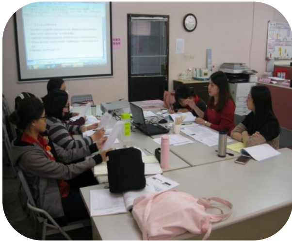
育英老服科學生實習