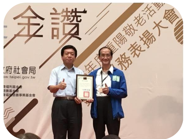
商澄吉居服員獲頒 106 年 臺北市社會局優良居服員獎