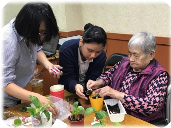
護理之家園藝輔療