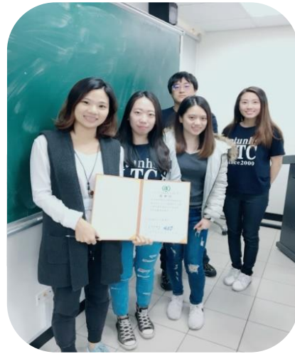
國北護健康大學長照系實習學生