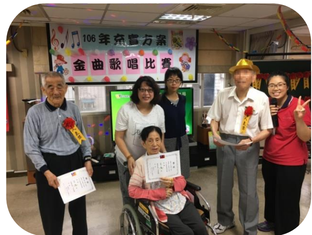
文山日照暨養護中心 卡拉 OK 歌唱比賽