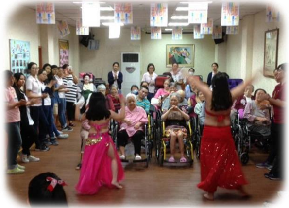
護理之家祖父母節活動