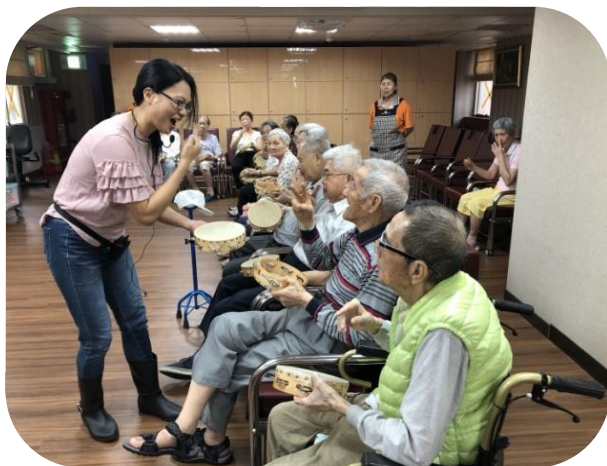
文山日照中心音樂輔療