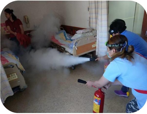
護理之家消防演練