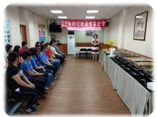
護理之家護師節暨社工師節餐會