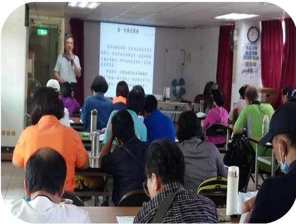
臺北居服園藝治療課