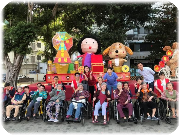
護理之家住民愛河畔元宵節賞花燈