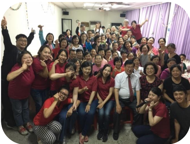
高雄居服員工聚餐合影