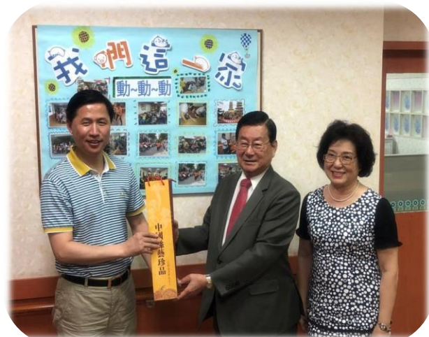
安徽省馬鞍山貴賓