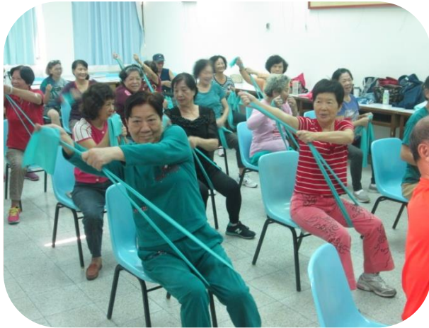
楠梓辦理預防及延緩失能課程