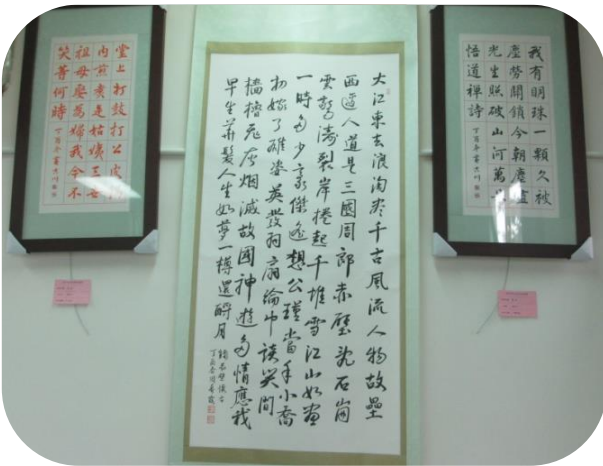
楠梓書法班成果展