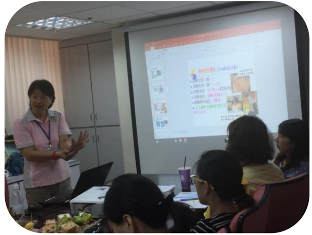
特聘暨居護急救訓練