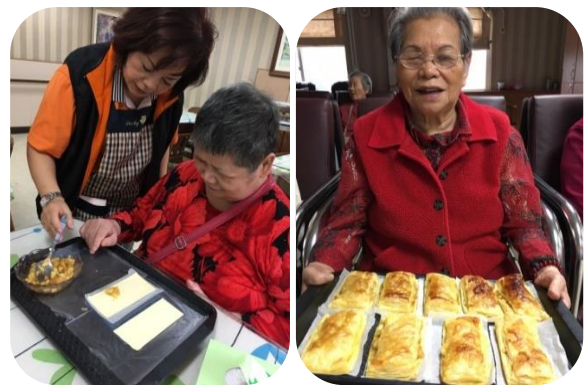
文山日照中心做蘋果派活動