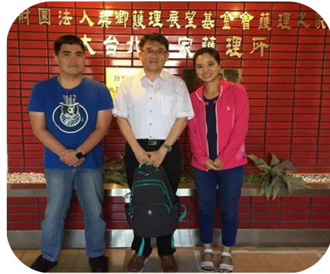
實踐大學社工系實習學生、 系主任及居服主任合影