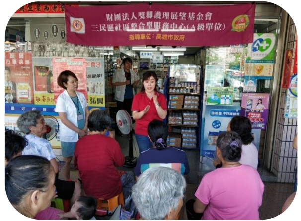
長照 2.0 宣導