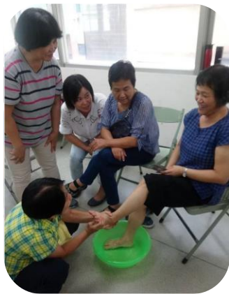
臺北居服足部護理課程