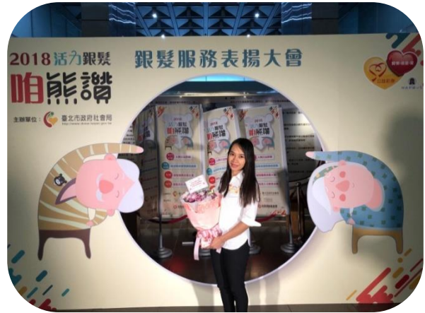
巫蒂照服員獲頒 107 年臺北市社會局 外籍照服員服務優良獎