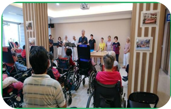
護理之家-七賢禮拜堂傳福音