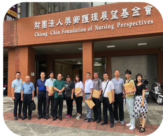
河南省海峽兩岸促進協會參訪