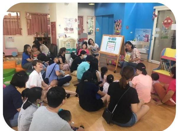
楠梓老幼共融- 銀髮志工繪本說故事培訓