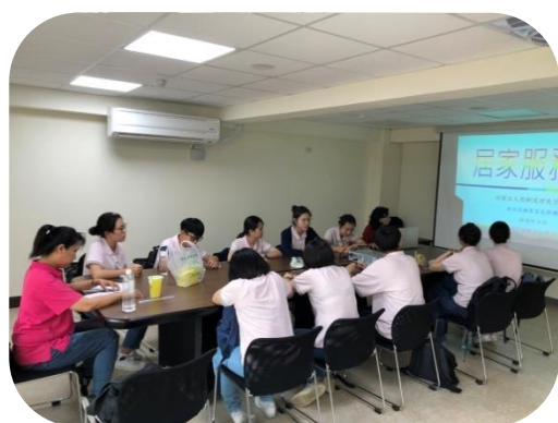
育英醫護管理專科學校 老人服務事業管理科見習