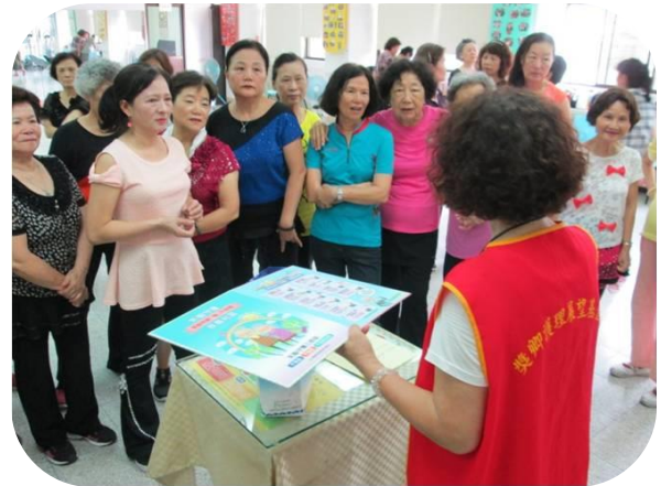
培訓志工-社區健康促進宣導