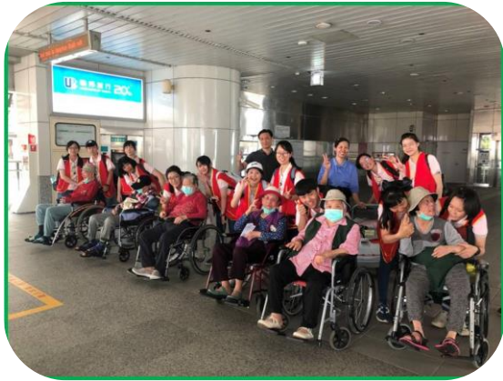
護理之家住民春遊-覓密基地