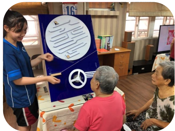
康橋學生志工 陪文山長輩玩遊戲