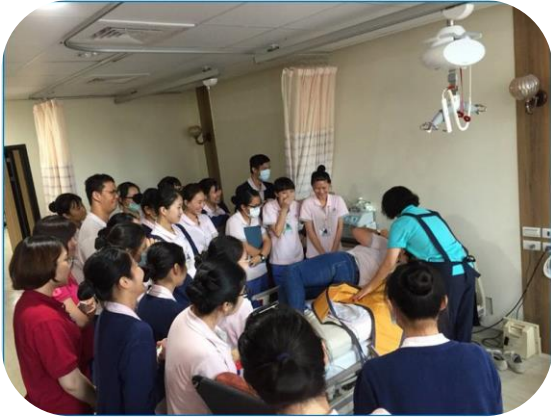
護理之家移位機操作教學