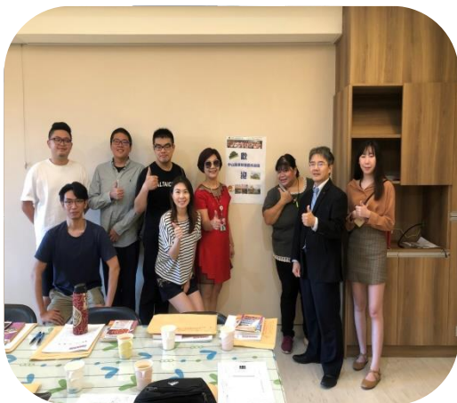
中山醫學大學醫管系參訪