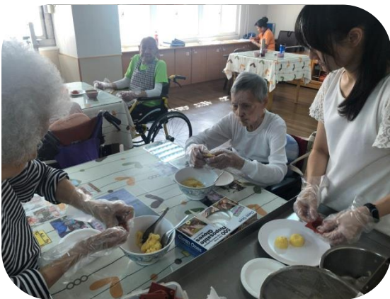
文山長輩做綠豆糕