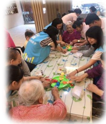
護理之家- 方舟志工與住民玩桌遊