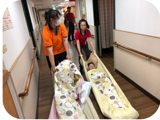
文山老人養護中心防災演練