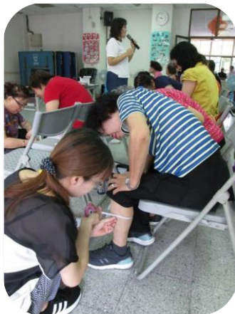
楠梓推廣銀髮健康餐盤- 營養師為長輩量小腿圍