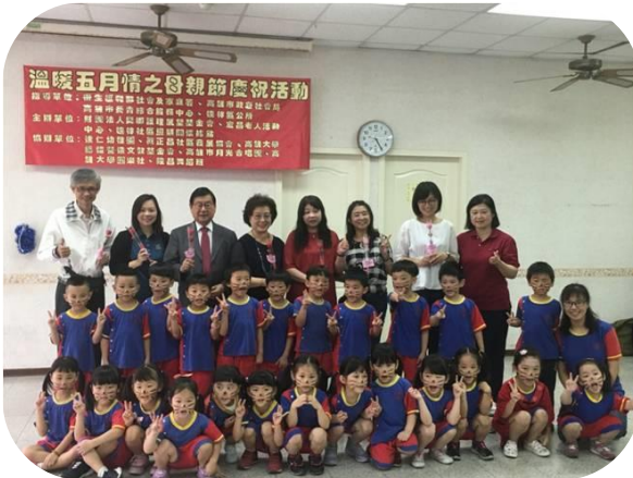
楠梓慶祝母親節活動