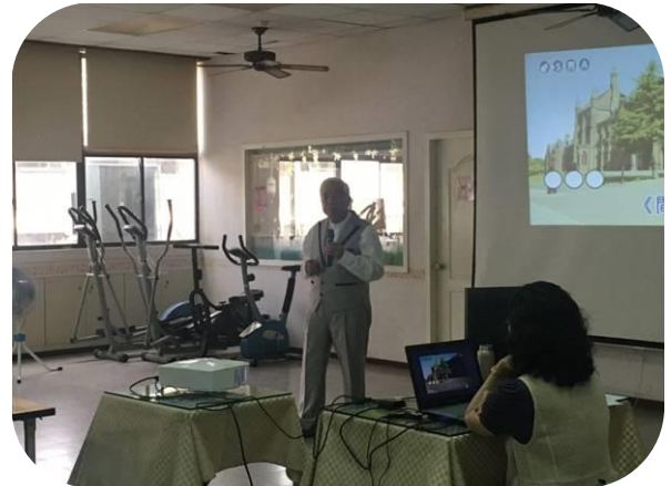
楠梓 2019 歡樂盃歌唱大賽