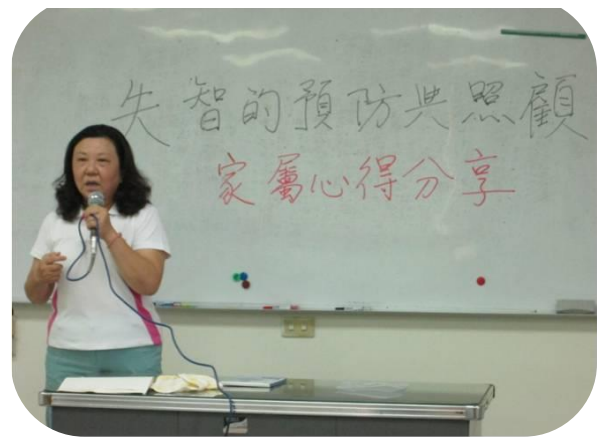
楠梓辦理失智症照顧課程