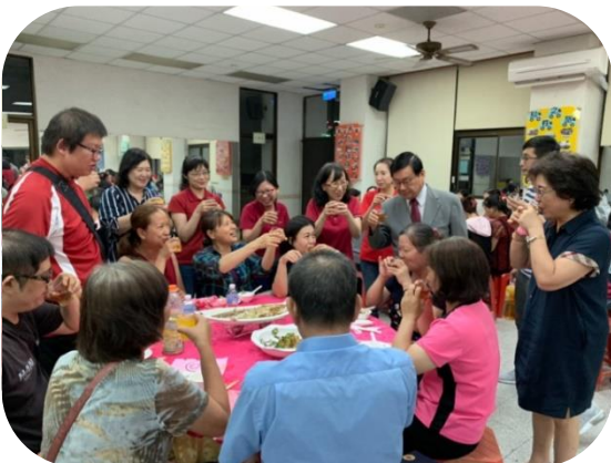
高雄居服員工聚餐合影