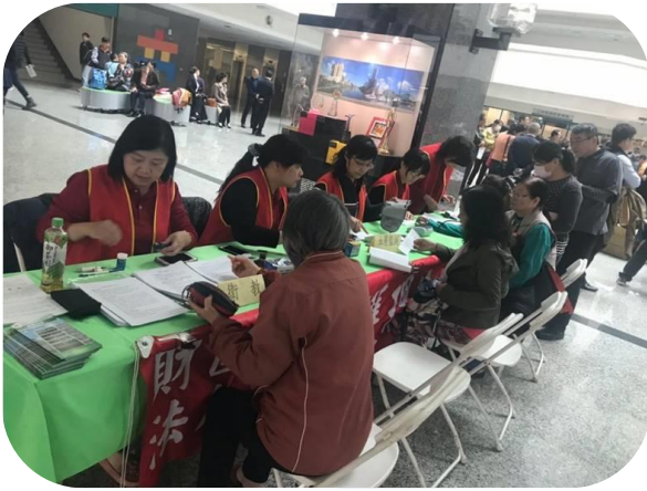
三高疾病防治宣導