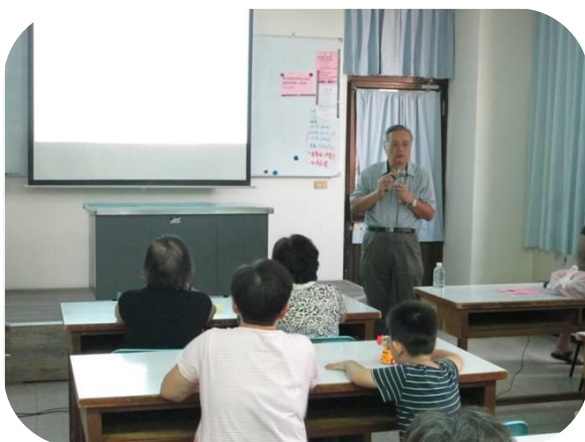
楠梓辦理靈性關懷與 預立醫療照護課程